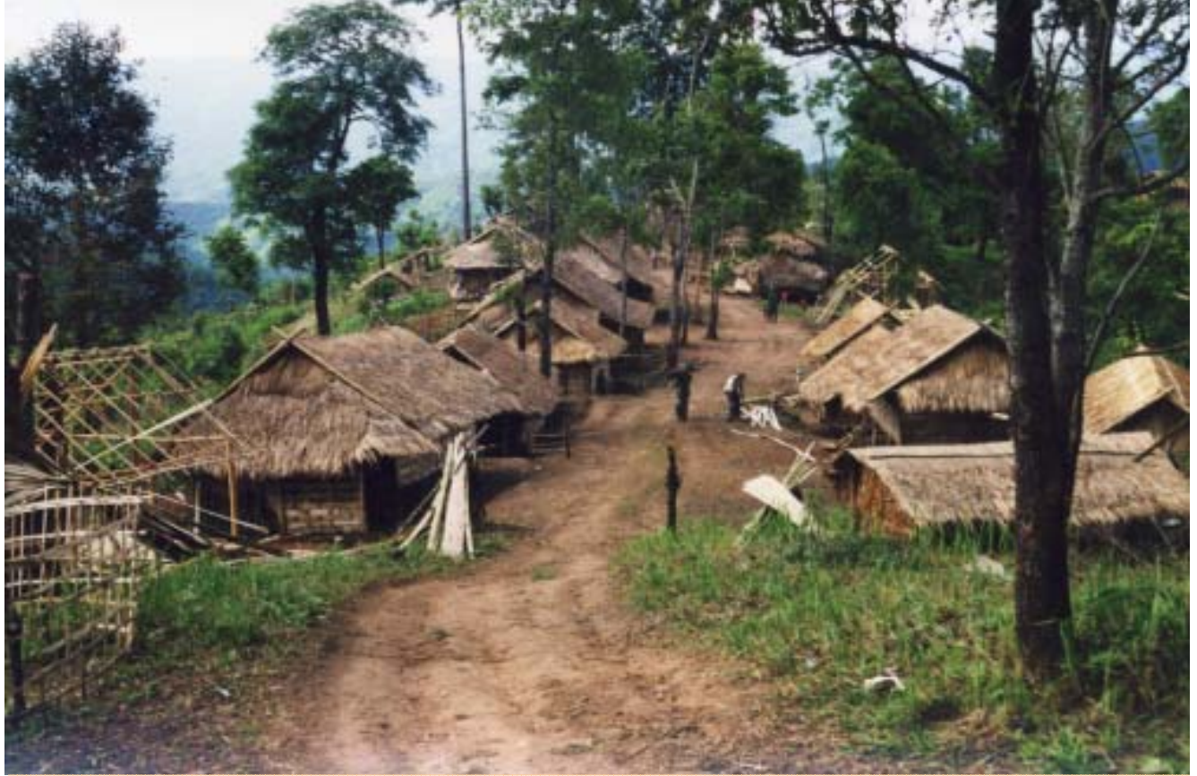
معسكر للاجئين من قبائل الشان العرقية من ميانمار على حدود تايلاند، 2001

الأمن: ضرورة أم ذريعة؟ من الأسباب التي تثار في معرض تأييد عزل اللاجئين هو أن السماح لهم بحرية الاستيطان من شأنه أن ينطوي على تهديد للأمن. فالرعايا الأجانب الذين يعيشون وينتقلون بكل حرية في مناطق حدودية محل نزاع يمكن أن يشكلوا نوعاً من المخاطر، أما اللاجئون فمن الممكن أن يصبحوا بؤراً للاضطرابات السياسية أيضاً. 44 وتقول باربارا هاريل بوند "إن الحفاظ على الطابع المدني لأحد المعسكرات يكاد يكون من الأمور شبه المستحيلة" 45 ويعتبر اللاجئون في أغلب الأحوال هدفاً للغارات التي تشن عليهم عبر الحدود، ويتم تحميل حكومات الدول المضيفة المسؤولية عن ذلك. 46 ومما يدعو إلى السخرية أنه إذا كانت للتوترات الحدودية أي أثر في أية قيود تفرض على حركة اللاجئين غير المسلحين، فإنه يكون من باب أولى أن تؤدي هذه التوترات إلى العمل على منحهم حرية الحياة في أي مكان آخر غير الحدود. 47